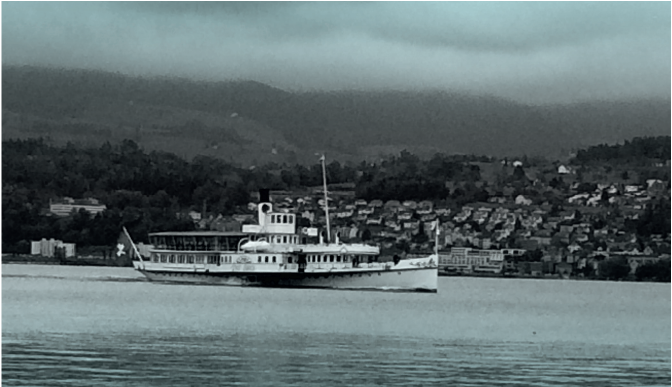
In Zürich sagt man „Ahoi“ zu manchen Öffis

Heute gibt es viel bessere technische Möglichkeiten.“ Falsch! Ich finde es gerade klanglich reizvoll, modernes und altes Equipment zu kombinieren. Ich habe da immer wieder Mikrofone miteinander verglichen und festgestellt, dass mir der Klang eines Röhrenmikros von Neumann aus den 1960ern extrem gut gefällt. Das besitzt einen anderen Frequenzgang und dadurch einen ganz spezifischen Klang, der nicht aufdringlich und spitz klingt, sondern weich und warm. Und genauso einen Klang wollte ich auch für „Listen to your Woman“.