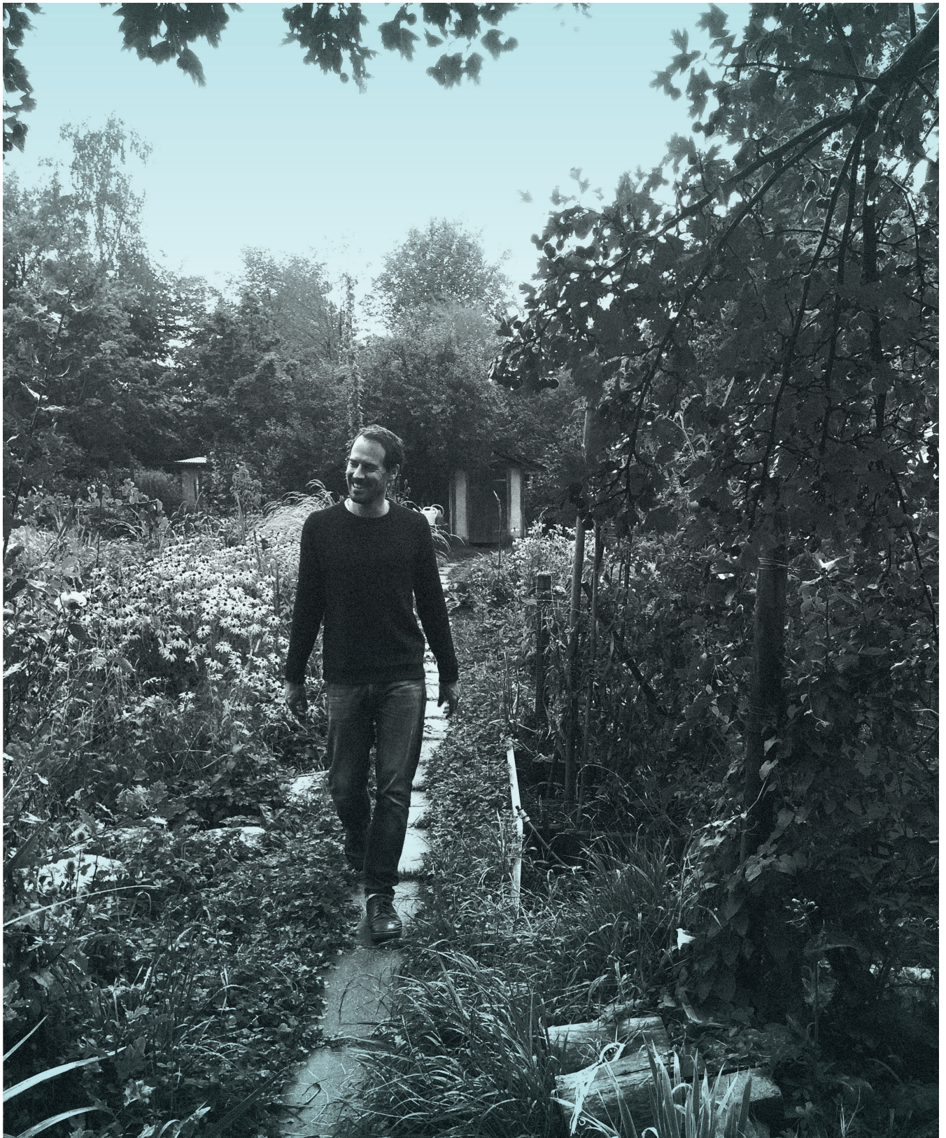
Sauberes Auto, gute Laune? Spieß-Quatsch. Gepflegter Garten, gutes Gemüse!