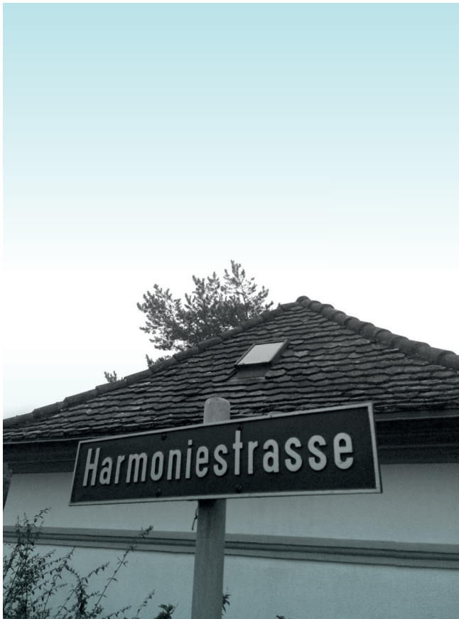
On Harmony Street am Zürichsee

am Ende von den teilweise ja total unterschiedlichen Ideen und Ergebnissen der Bands begeistert sind.