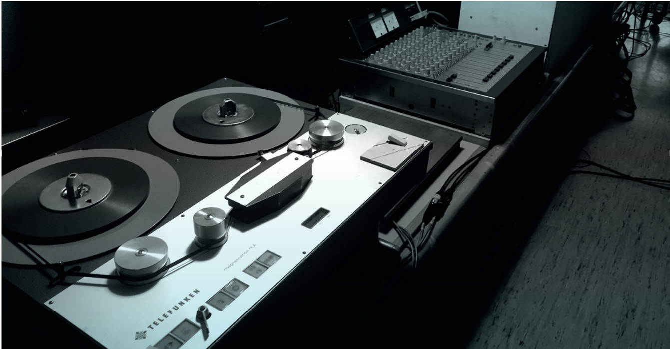
Stereobandmaschine Telefunken M15 1/4 Zoll

auch perkussive Elemente, die wie eine Art Posaunen-Beatbox funktionieren. Da ich nicht mit einer sogenannten Loopstation arbeite, einem elektronischen Hilfsmittel, mit dem man Phrasen aufnimmt, um sie dann in einer Schleife immer wiederkehren zu lassen, und doch Form, Akkorde und Rhythmus als Element verwende, habe ich mich eines Tipps des Posaunisten Conny Bauer bedient. Er sagte mir, dass das menschliche Gehör fähig sei, auch kurzfristig erfasste Strukturen wie Akkordabfolgen und Vamps – das sind sich wiederholende Muster, z. B. Basslinie, Akkorde oder Riffs, prägnante Einwüfe – innerlich weiter zu hören, auch wenn sie schon verklungen sind. Ich impliziere also solche Strukturen durch eine mehrmalige Wiederholung und improvisiere dann darüber. So entsteht der Eindruck einer Band, obwohl immer nur eine einzelne Person spielt.